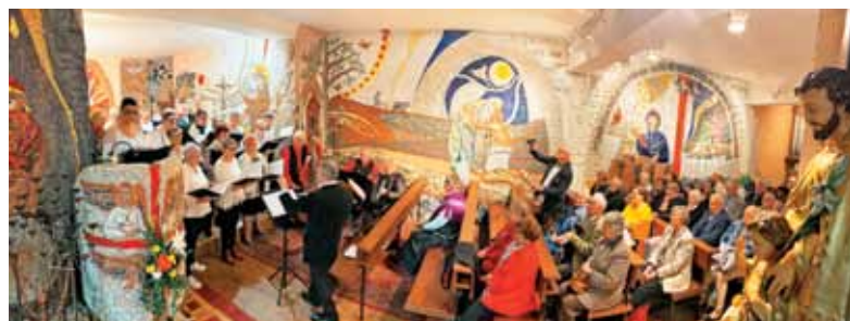
Ob 15.30 se je pričel koncert zbora Jadran.