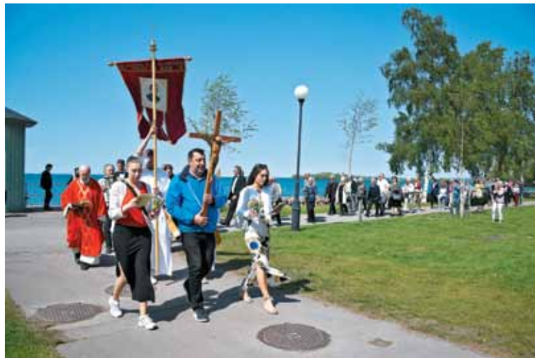
Procesija na 50. jubilejnem romanju se vrača nazaj v cerkev k sestram Sv. Brigite Švedsk