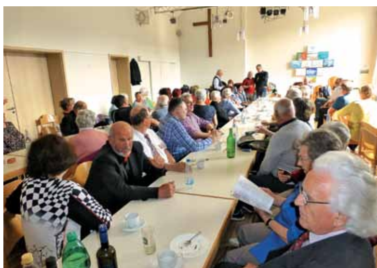
Prijetno druženje v Hildnu