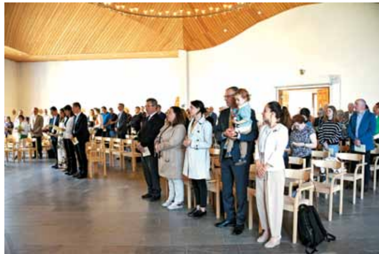
Naši gostje in ostali romarji na 50. vseslovenskem romanju