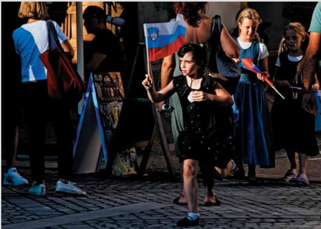
Novo mesto - slovenski utrinek na "Dobrodošli doma" leta 2022. Letos bo prireditev 1. julija v Vipavi