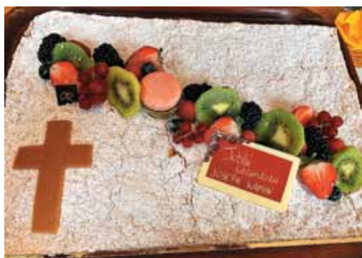
Dan smo zaključili z razdelitvijo jubilejnih tort.