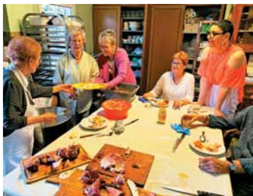
V kuhinji je na ta dan še živahnejše.