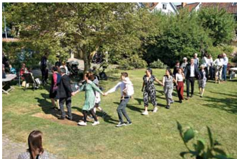
Po procesiji se je na vrtu ob veseli muziki razvilo tradicionalno kolo