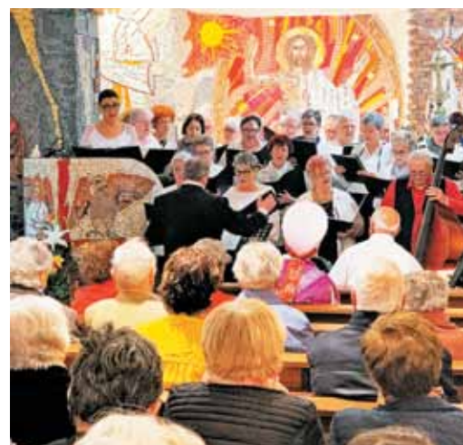
Marijine pesmi v majniku zvenijo milejše.