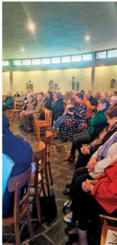
V okrogli cerkvi v Habsterdicku se ljudstvo čuti še bolj obdano z Marijinem plaščem.