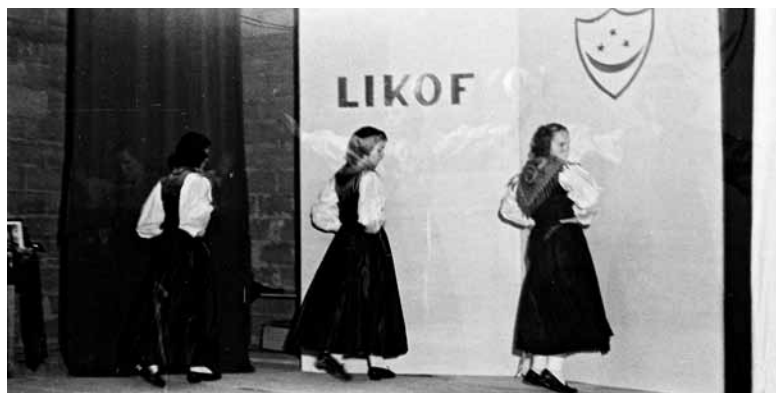
Rajalni prikaz ob likofu.