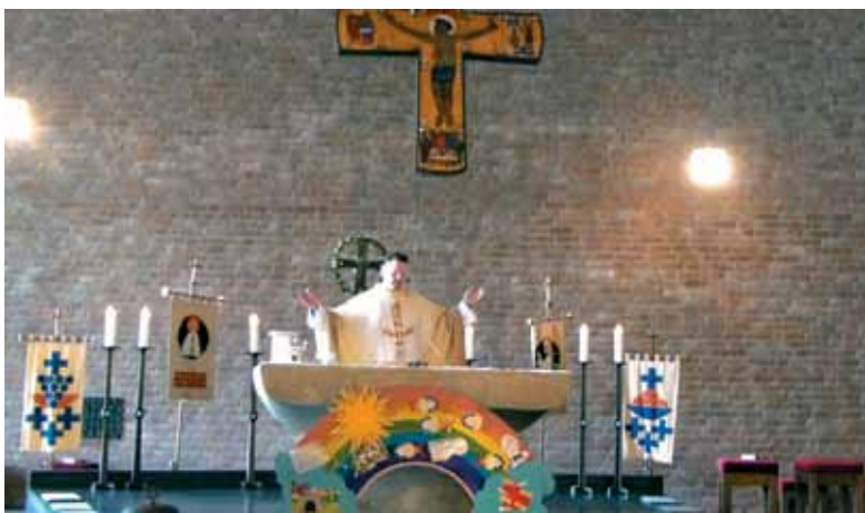
Daritev svete maše v cerkvi sv. Marije, Hilden