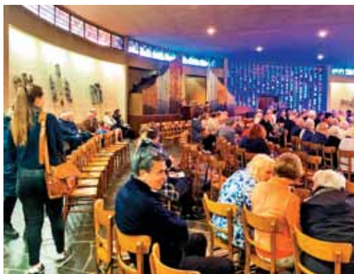
Kmalu bomo ponovno zapeli: »Špet kliče nas venčani majl«