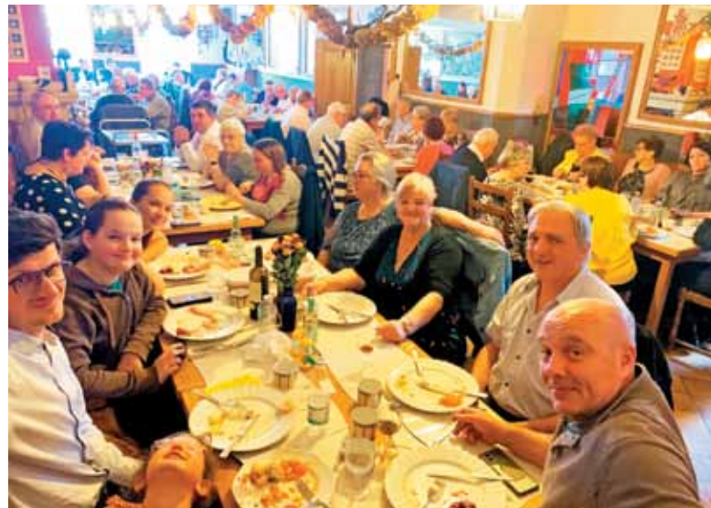
Pod streho slovenske misije je bilo živahno v vseh nadstropjih.