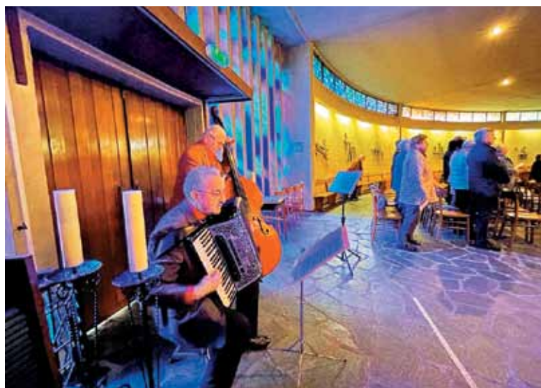
Harmonika in kontrabas v senci orgel in združenih pevcev dajo tudi svoj doprinos.