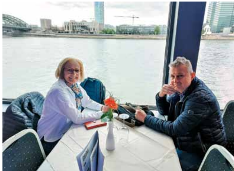
Zakonca Turk na romanju

Prijateljstvo je istočasno balzam za življenje in dar, ki nam ga poklanja Bog. Ni samo bežno čustvo, temveč resnična ljubezen, »je stabilno, trdno, zvesto, zori skozi čas«. Za nekatere je to najvišji izraz ljubezni, saj nam omogoča, da cenimo drugega človeka samega po sebi. Prijateljstvo »je pogled na