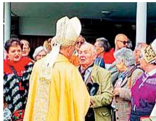
Prisrčen osebni stik zaznamuje.