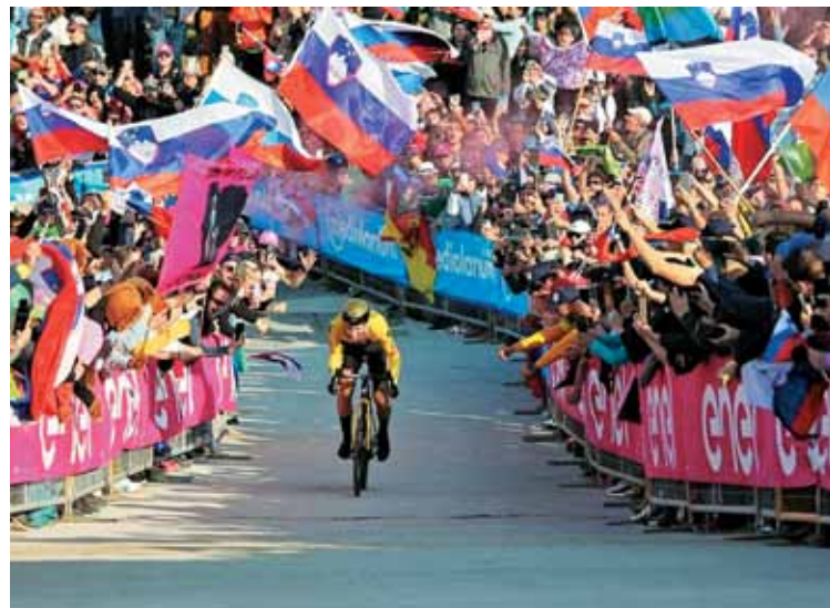
Primož Roglič

Britanski komentatorji so gledalcem razložili, da je ta nepregledna množica zastav belo-modro-rdeče barve, ki jih vidimo vsepovsod na prizorišču, slovenska zastava. Slovenski navijači so jih v izjemno velikem številu ta dan vihteli vsepovsod ob trasi, jih izobesili po terenu ali se odeli vanje. Kot da bi bil kak slovenski praznik! Britanski napovedovalci so tudi komentirali, da se tekma odvija v neposredni bližini Slovenije, ki je od Višarj oddaljena le 16 km. Tudi med prenosom tekme smo lahko med reklamami videli čudovite posnetke naše prelepe Slovenije: slovenska mesta (Piran, Ljubljana, slovenski gradovi) in narave (Blejsko jezero, lipicanci, Soča, Gorenjska). Tako je lahko marsikateri gledalec tudi preko kolesarske dirke Giro d'Italia spoznal našo državo in obenem začutil vesel karakter navijačev s sončne strani Alp, ki znajo tako pozitivno in močno podpreti svoje sonarodnjake na tekmi.