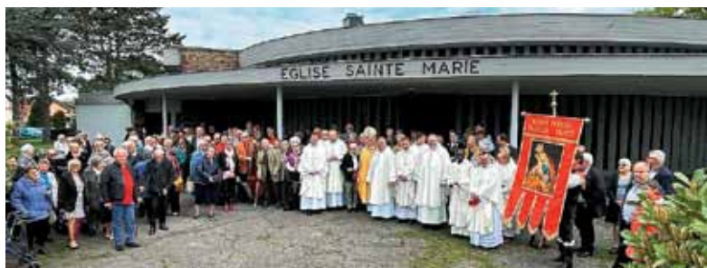
Obrazi vidno žarijo ob doživeti evharistični daritvi.