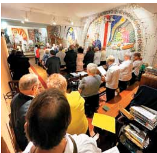
Pred Najsvetejšim smo se Bogu zahvalili za vse milosti.