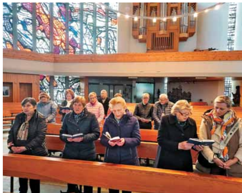
Zbrani pri sveti maši v Pfullingenu