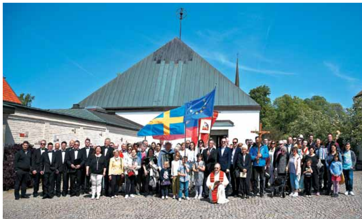
Skupinska fotografija romarjev na 50. vseslovenskem romanju