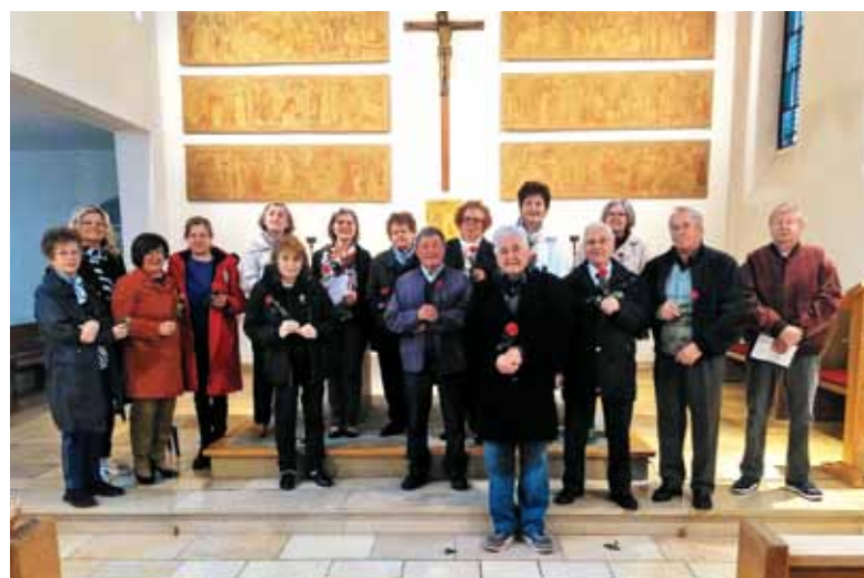
Praznovanje materinskega dneva v Augsburgu

V Ulmu je v nedeljo, 14. maja, v cerkvi Svetega Duha (Heilig Geist) potekala prireditev »Mamica je