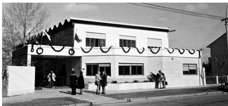
Novi društveni dom, poimenovan po msgr. Janezu Hladniku.