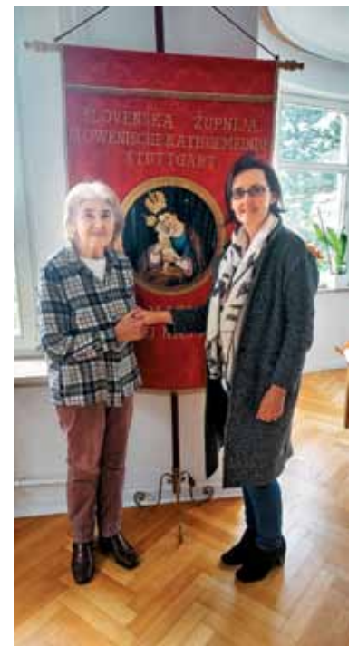
Mama in hči Zertuš na obisku

govi učenci. Preden je trpel, jim je Učitelj hotel pokazati, da jih je ljubil s prijateljstvom, ki je segalo onkraj smrti, da jih je ljubil »do konca« (Jn 13,1). Ta »skrivnost« radikalnosti njegovega prijateljstva je ena izmed zaupnosti, ki jo je Kristus razodel pri zadnji večerji. Svojo željo, da bi se ta moč po vseh kristjanih nadaljevala skozi stoletja, je takrat izrazil z razglasitvijo nove zapovedi: »Kakor sem vas jaz ljubil, tako se tudi vi ljubite med seboj!« (Jn 13,34). Nato je še dodal: »Po tem bodo vsi spoznali, da ste moji učenci« (Jn 13,35); se pravi: moji prijatelji bodo prepoznani po svojem načinu, kako ljubijo druge.