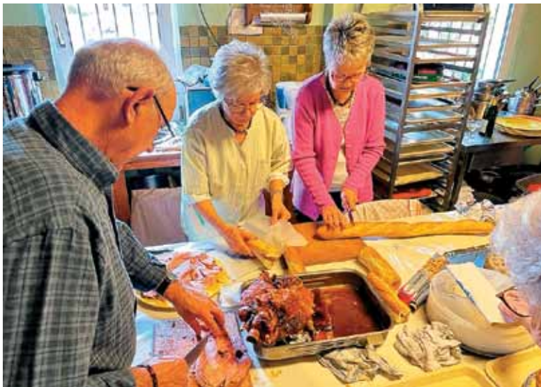
Skrbna priprava sendvičev za pevce Jadrana po koncertu.