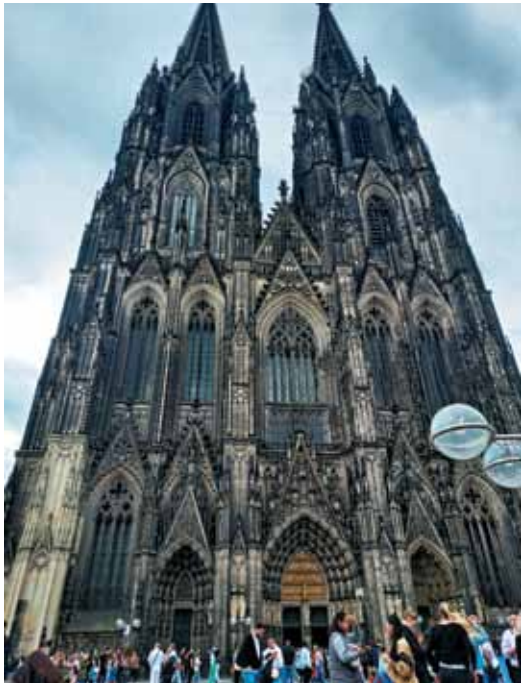
Stolnica v mestu Köln

Petrom, Janezom in vsemi njegovimi učenci je zaznamovano z gorečo željo po tem, da bi živeli v Očetovi