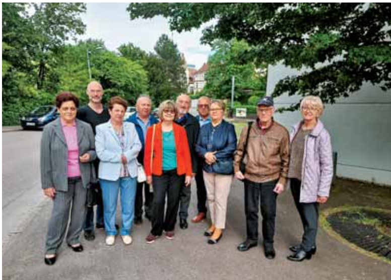
Verniki iz Stuttgarta

ropane in uničene zaradi bombardiranja. Bili so povsem neuporabni. Med ruševinami je našel zaprašen plakat, ki je nekoč visel na steni v čitalnici. Na uokvirjenem napisu, ki je nekoliko spominjal na pergament, so bile v latinščini zapisane tiste prej omenjene besede nove zapovedi, ki jih je Jezus zaupal svojim apostolom: » Mandatum novum do vobis ... «, »Novo zapoved vam dam ...« (prim. Jn 13,34-35). Nekoč so ga obesili tja, ker je bil to strnjen opis vzdušja, ki si ga je sv. Jožefmarija želel tudi za centre Dela; ti naj bi bili »kraj, kjer bodo mnogi ljudje našli iskreno ljubezen in se bodo učili biti resnični prijatelji«. Po katastrofi vojne, ko je bilo treba začeti praktično iz nič, je bilo tisto, kar je bilo zares pomembno, še vedno ohranjeno: eden od temeljev za gradnjo na novo bo zvestoba tej sladki Gospodovi zapovedi.