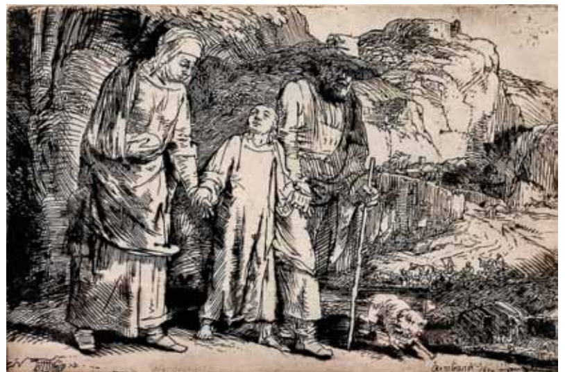
Jezus na poti iz templja z Jožefom in Marijo