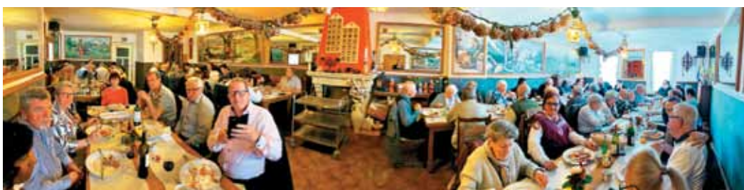
Prvomajsko romanje nas prijateljsko poveže tudi pri skupnem kosilu.