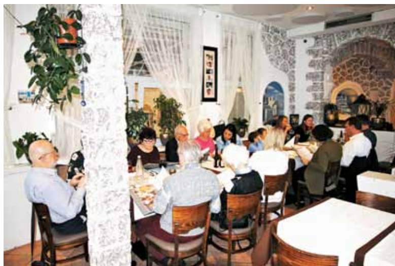
Slavljenca sta nam pripravila večerjo v bližnji grški restavraciji.