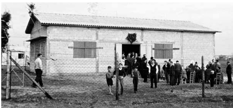
Prvi društveni dom Slovenske vasi, zgrajen leta 1956.

Objavljamo nekaj fotografij o teh treh dogodkih, ki so dokumentirani v fotoarhivu Rafaelove družbe.