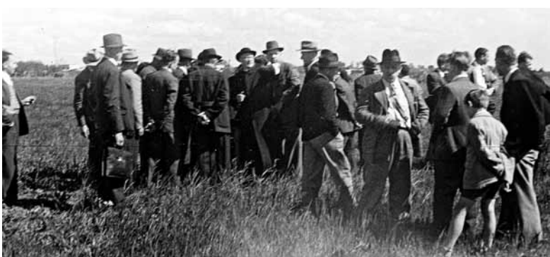
Ogled terena interesentov za nakup parcel v Slovenski vasi.