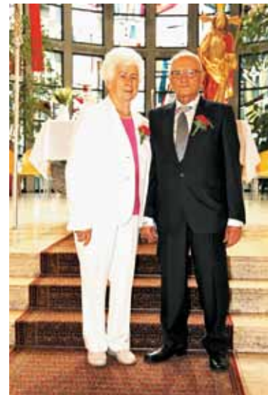
Biserna zakonca pred oltarjem cerkve Marijinega srca v Frankfurtu