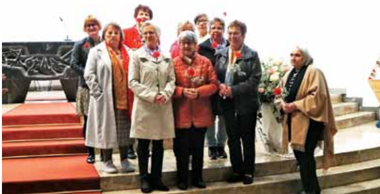
Na materinsko nedeljo v Ulmu je vsaka gospa prejela rdeč nageljček.

kakor zarja ...» v počastitev materinskega dneva. Začeli smo s sveto mašo, ki ji je sledil kulturni program. Slišali smo izbrane recitacije iz zakladnice slovenske poezije na čast mamam in njim lastnemu poslanstvu, materinstvu.