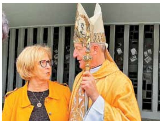
Naši rojaki so iz vse Slovenije, tudi iz Pirana.