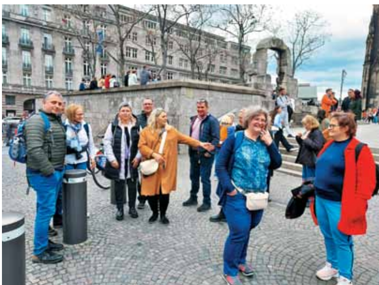
Pred stolnico v Kölnu

Če se na straneh Prve Mojzesove knjige razodeva ljubezen Boga, ki nas je ustvaril po svoji »podobi«, pa smo ob učlovečenju njegovega Sina spoznali še nekaj mnogo bolj navdušujočega. Jezusovi apostoli so tri leta živeli ob Njem, ki je bil njihov najboljši prijatelj, ne da bi se ločili od njega. Klicali so ga rabi, kar pomeni »učitelj«, ker so čutili, da so ne samo prijatelji, ampak tudi nje-