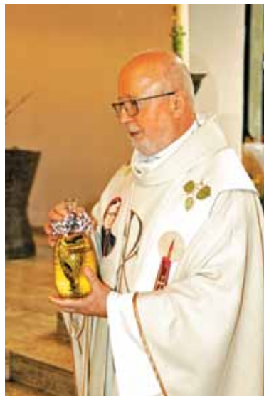
Steklenica z blagoslovljenim svatovskim vinom, ista kot pred šestdesetimi leti