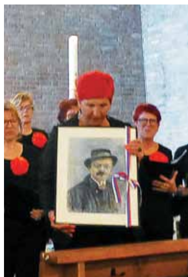
Slika Ivana Cankarja ...